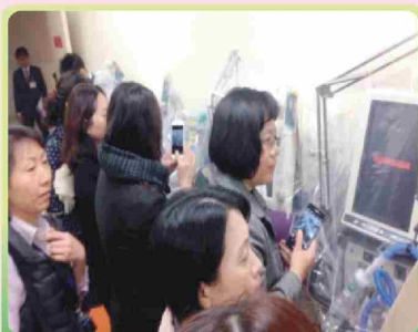
順天堂醫院 醫工室