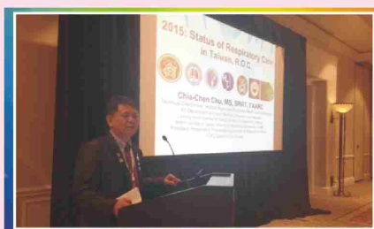
在世界呼吸照護聯盟會議向各國(現有29個國家與會)報告台灣呼吸治療專業發展現況。