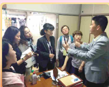
家訪 (右二為個案母親)