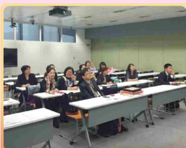
順天堂大學 工作坊