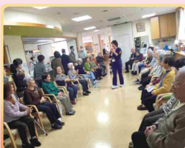
老人團體活動 白十字病院