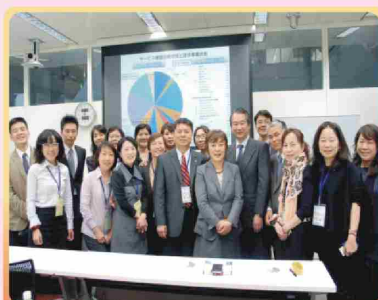
順天堂大學 工作坊