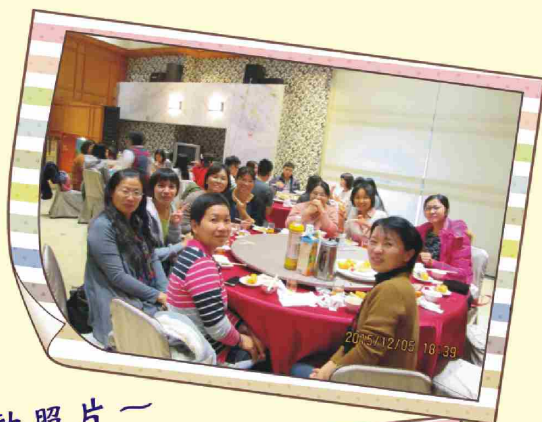
一 研討會及聯誼聚餐活動照片一