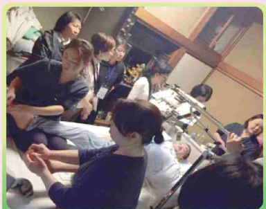
家訪 護理師與照服員