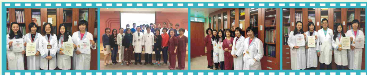
湖南省人名醫院，兩位醫師兩位呼吸治療師於2015年10~12月至高雄長庚紀念醫院呼吸治療科學術交流

高雄長庚紀念醫院的真正魅力，既不是花俏的儀器設備，也不是孤立的呼吸治療技術，而是整個醫療團隊多科室醫護的精誠合作，是討論問題時候的一絲不苟，是真真切切做到實處的人文關懷！三個月參訪學習已經結束，時間雖短，但彌足珍貴。我會更加努力去學習呼吸治療先進的理念和技術，為我省呼吸治療事業的發展貢獻自己的綿薄之力。