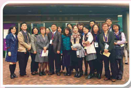
全體參訪團員與依藤隆子教授(左四)合影。