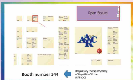
共有172家廠商參展，美國呼吸照護學會給予的免費攤位位置：344。