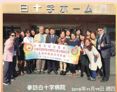
參訪白十字病院 2015年11月19日 週四