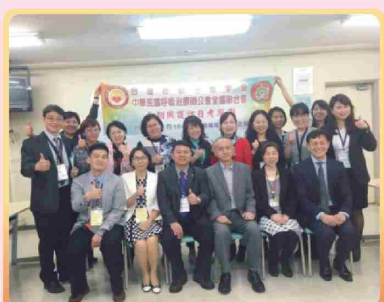
日本福祉教育專門學校 副校長等合影