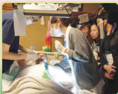
家訪 居家牙醫團隊潔牙