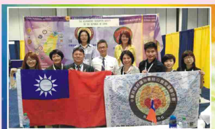
結束後大合影及展示成果(至攤位致意的美國呼吸照護學會會員及各國貴賓簽名)。