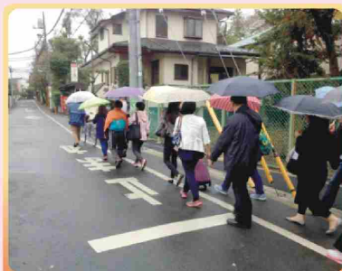
天寒風雨無阻 參訪