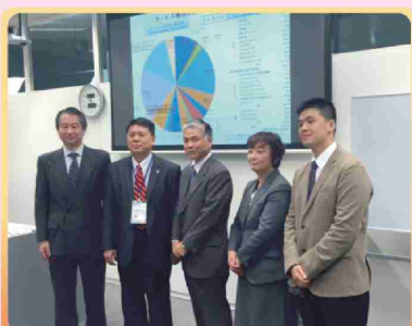
順天堂大學 工作坊合影