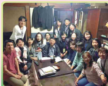
家訪 家屬與居家訪視員合影