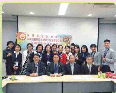
與日本呼吸器學會合影