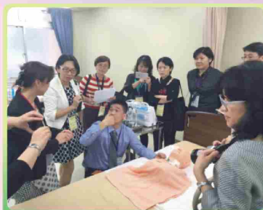
高田馬場 福祉教育專門學校