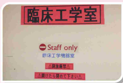
參觀到臨床工學室，呼吸器維修保養的地方。

與日本呼吸治療專業的接觸，始於1993年Koga醫師在福岡舉行的Pan-Pacific on Respiratory Care Forum，當時中華民國呼吸照護學會(台灣呼吸治療學會的前身)受到Koga醫師的邀請，組團參加，也是呼吸治療師專業團體第一次集體參訪日本；此次是第二次，由台灣呼吸治療學會和中華民國呼吸治療師公會全國聯合會聯合組隊，可說是收穫滿滿，每天都有專人做筆記，將有更詳細的單元呈現，在此僅做一簡單的成果論述。