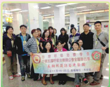
出發前，在松山機場團體合影