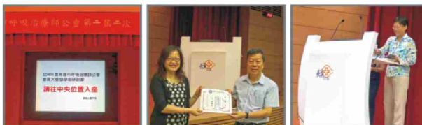
104年度高雄市呼吸治療師公會 第二屆第二次 會員大會暨學術研討會