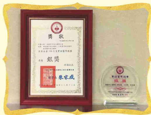
第二屆第二次高雄市呼吸治療師公會會員大會暨學術研討會